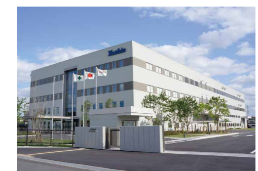
テクニカルセンター